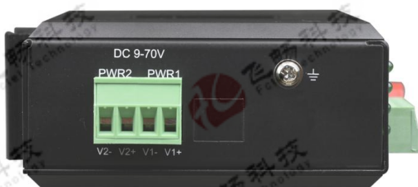
双 DC 电源供电