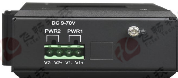
双 DC 电源供电